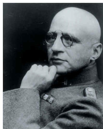
Fritz Haber, de uitvinder van het gifgas

Wélke waarheid mocht Otto niet vertellen? Otto Hahn heeft grote faam in wetenschappelijke kringen, maar niet bij iedereen zal er een belletje gaan rinkelen. Daarom wil ik hem kort voorstellen.