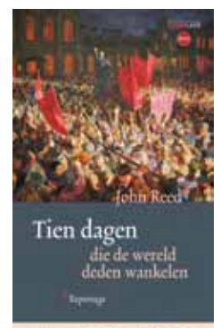
John Reed, Tien dagen die de wereld deden wankelen , Uitgeverij Schokland, 320 pagina's (€ 24,00)

Het boek is een fascinerend en goed geschreven verslag van een kantelpunt in de geschiedenis.