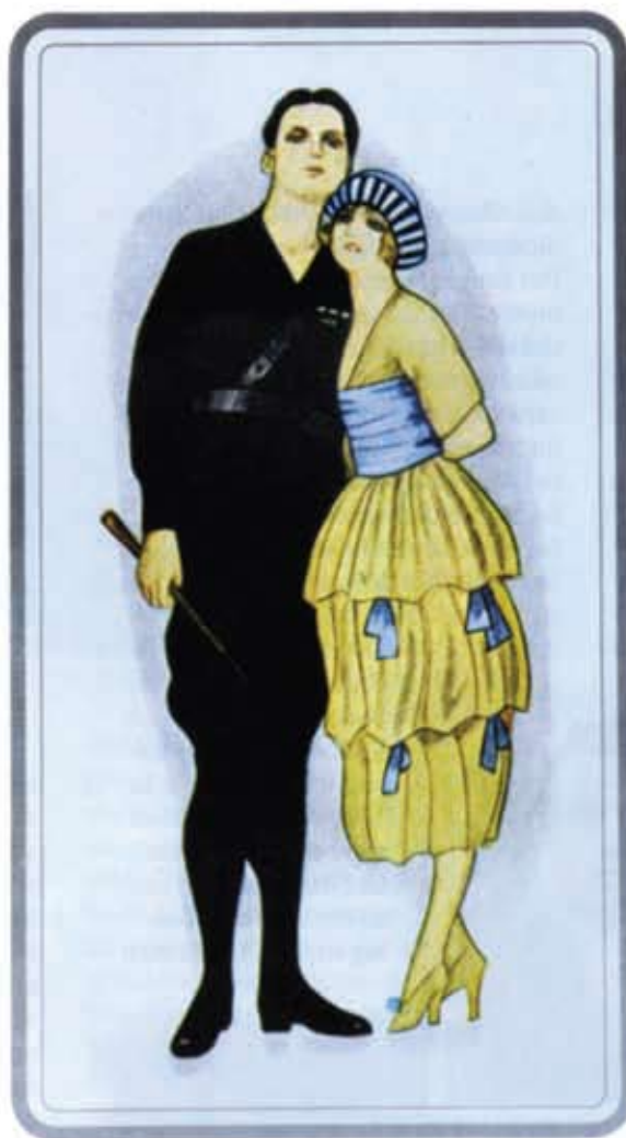
✦ Intellectuelen zoals Vittorini raakten vervreemd van het fascisme, onder andere omdat het niet het grootse en meeslepemde leven bracht waarop zij gehoopt hadden. De romantische maar ook enigszins klungelige fascist op deze Italiaanse illustratie lijkt inderdaad mijlenver af te staan van het antiburgerlijke ideaal.

Er was wel een constante: in Vittorini's romans en politieke artikelen bleef de afkeer van de burgerij een sterke drijfveer; die deed hem ditmaal echter kiezen voor het communisme. Hij ontwikkelde zich zelfs tot een uitgesproken criticus van Mussolini's bewind en kwam hiervoor tijdens de oorlog enige tijd in de gevangenis, tot de Duitsers Italië bezetten in 1943. Hij sloot zich in Milaan, waar hij toen woonde, aan bij het anti-Duitse verzet van de partizanen, werd in 1942 lid van de Communistische Partij en